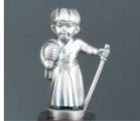
精皆勤賞へのトロフィー