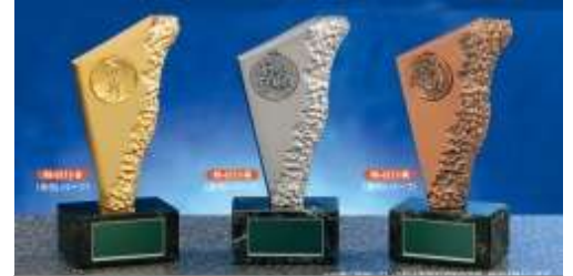
年間表彰者へのトロフィー

※トロフィーなどは都度状況より変更いたします (楯など、また参加人数によってメダル数も変更になります)