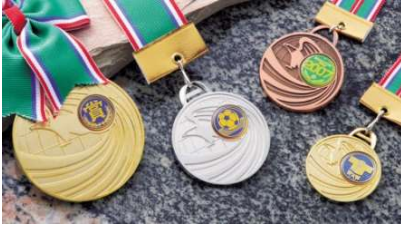
年4回の月例大会メダル(優勝、2位、3位)